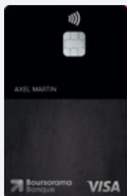
Carte ULTIM (1) Débit immédiat ou différé